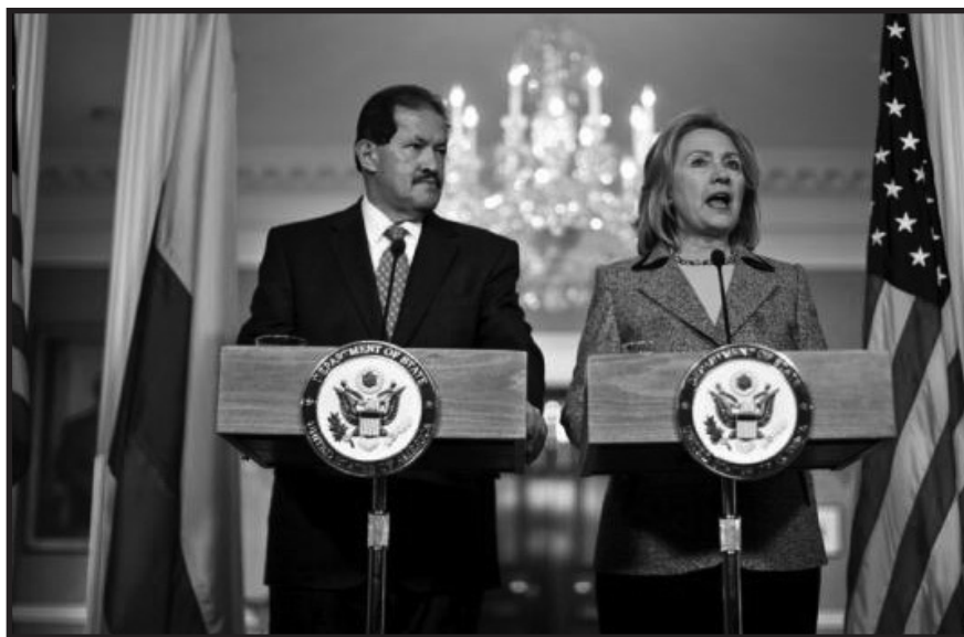
La Secretaria de Estado, Hillary Clinton, habla con el Vicepresidente de Colombia, Angelino Garzón, en una conferencia de prensa en Washington, DC el 28 de enero del 2011. Ambos reiteraron su apoyo para el tratado de libre comercio entre Colombia y los Estados Unidos.

Aunque las condiciones laborales claramente representan una mejora sobre el CAFTA, no han sido probadas y USLEAP, entre otros, es escéptico sobre su eficacia. Hasta la fecha, la experiencia de USLEAP es que las protecciones laborales del CAFTA son bastante más débiles que las contenidas en los programas de preferencia comercial, por ejemplo el Sistema Generalizado de Preferencias. ©