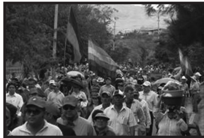
Protestors march in opposition to the one-year anniversary of Honduran President Porfirio "Pepe" Lobo's inauguration on January 27, 2011.